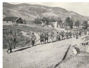
Passaggio di soldati italiani in un villaggio