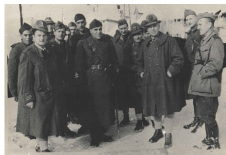
Gruppo di soldati