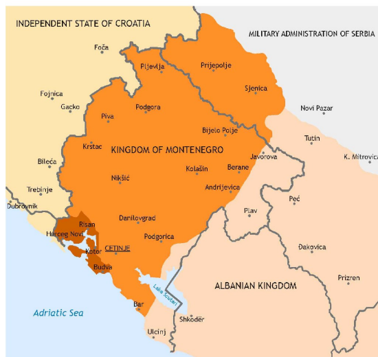
Mappa del territorio montenegrino dove opera la Divisione Garibaldi