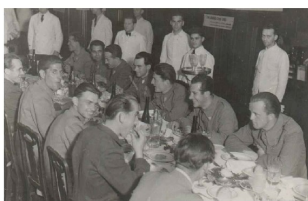
Cena di fine guerra tra compagni