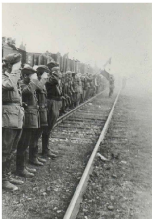
Il rientro in Italia della divisione Italia Archivio storico ANVRG