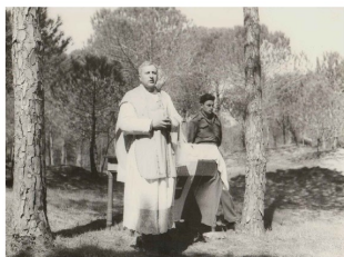
Funzione religiosa in guerra