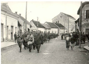
Il Battaglione Garibaldi (poi divisione Italia) per le strade di un villaggio