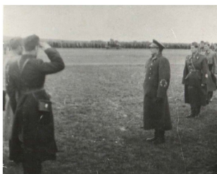
Il Maresciallo Tito in visita ai reparti italiani