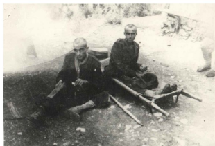
Soldati feriti e ammalati al rimpatrio