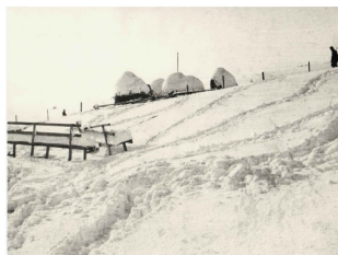
Soldati di pattuglia a Pljevlja