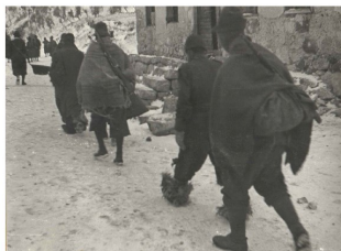
In marcia