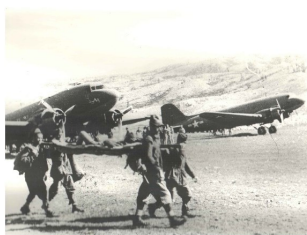
In guerra, campo d'aviazione

Gli italiani che inizialmente confluiscono nella zona della divisione Venezia per costituire poi la Garibaldi sono circa 20.000. Rimpatriarono, inquadrati e in armi, meno di 3.800 uomini. Alla fine della guerra, si conteranno 3.556 caduti accertati, circa 5.000 dispersi, pari a 8.500 caduti in totale, ovvero più del 40% degli effettivi iniziali.