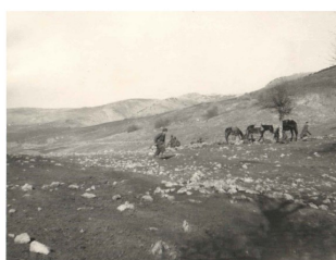
Operazioni militari e bombardamenti