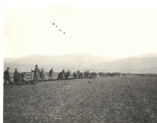
Soldati a lavoro nelle retrovie