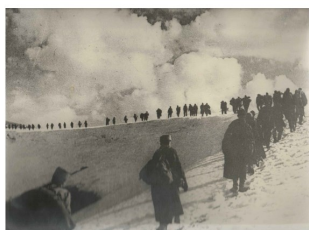
In marcia verso Pljevlja