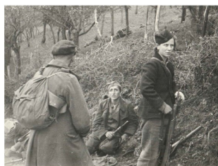
Patuglia partigiana jugoslava