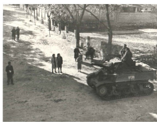
Carro armato italiano a controllo di un incrocio