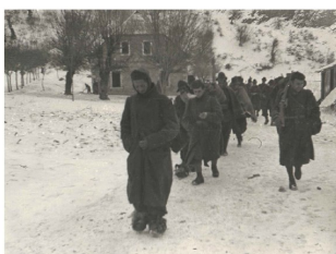
Reparto della divisione Garibaldi in marcia