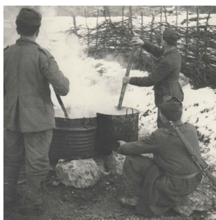
La pulizia dei vestiti