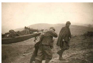
Trasporto dei feriti