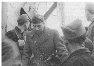
Il Generale Giovanni Battista Oxilia

Fratello di Nino Oxilia, autore di "Giovinezza", inizia la carriera militare durante la Prima guerra mondiale. Allo scoppio del secondo conflitto viene nominato capo della missione militare a Zagabria, in seguito comanda la divisione Brescia a El Alamein e, dal luglio 1943, la divisione Venezia in Montenegro. Dopo l'Armistizio evidenzia freddezza e doti diplomatiche non comuni, mantenendo la divisione compatta in circostanze sfavorevoli. Il 20 ottobre 1943 raggiunge infine un accordo di cooperazione con i partigiani jugoslavi, che porta alla costituzione della divisione Garibaldi, di cui diviene il primo comandante. Rimpatriato per via aerea il 15 marzo 1944, viene nominato Sottocapo di stato maggiore dell'Esercito e in seguito Sottosegretario alla Guerra e comandante della Guardia di Finanza.