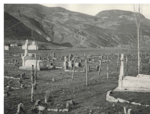
Tombe di soldati italiani a Berane, Montenegro