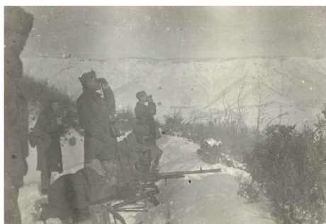
Al fronte, Natale 1943

In queste condizioni a tenere alto il morale dei soldati rimangono solo il conforto religioso, dato dai coraggiosi sacerdoti presenti nelle brigate, e l'amicizia tra i commilitoni, funestata continuamente dalla perdita in guerra dei propri compagni più cari.