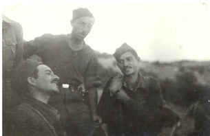
Partigiani del Battaglione Garibaldi (poi divisione Italia)