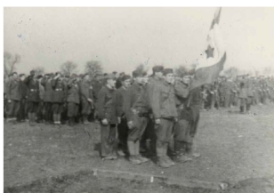
Cerimonia di consegna delle decorazioni ai soldati della Divisione Italia